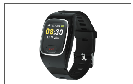
Abb.: Rufhilfe-Uhr, Rotes Kreuz

Die Rufhilfe-Uhr vom Roten Kreuz sieht auf den ersten Blick aus wie eine gewöhnliche Armbanduhr, hat jedoch einige hilfreiche Funktionen.