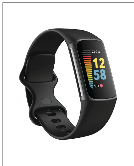
Abb.: Fitbit Fitnessstracker