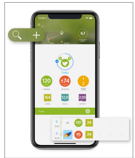
Abb.: mySugr-App (Diabetes) Medizinprodukt

Neben Gesundheits-Apps gibt es auch zahlreiche hilfreiche Apps für den Alltag.